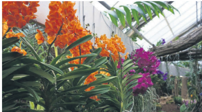
Bunt und vielfältig ist die Orchideenausstellung im Rombergpark.

aus dem eigenen Fußballleben beizutragen. Dazu läuft das „Borussenderby“ – Gladbach gegen Dortmund.